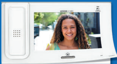
SÉRIE JP Portier vidéo JP, la protection idéale de votre logement