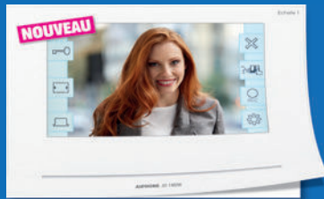
SÉRIE JO Wi-Fi Portier vidéo couleur moniteur Wi-Fi

DEMANDEZ NOS DOCUMENTATIONS POUR L'UTILISATEUR FINAL