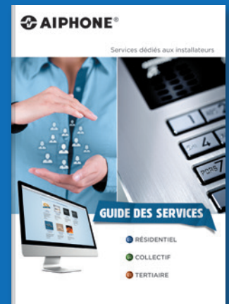
GUIDE DES SERVICES