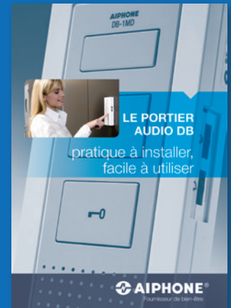
SÉRIE DB Le portier audio pratique à installer, facile à utiliser